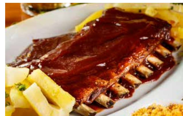
Outback Steak House