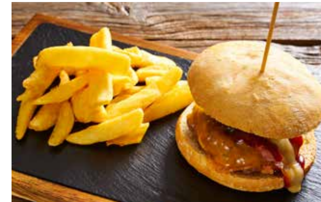
Madero Steak House